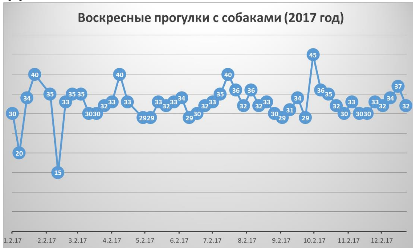
График посещения собак:

Количество участников, в среднем, 30 человек за поездку. Возрастная категория – от 5 лет и выше (несовершеннолетние дети допускаются на прогулку строго в сопровождении взрослых).